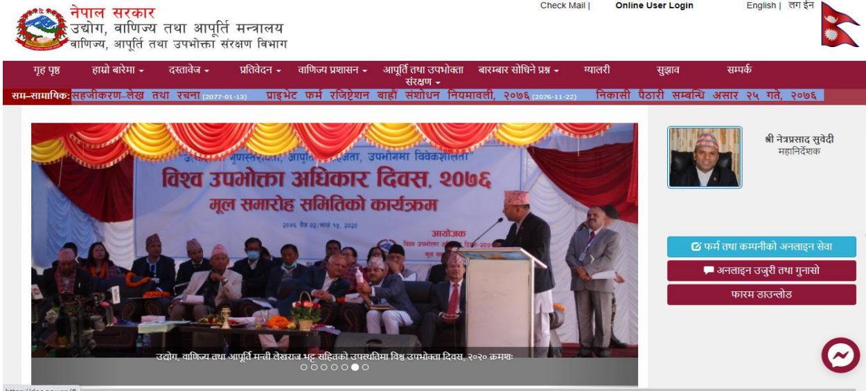
चित्र नं - ४