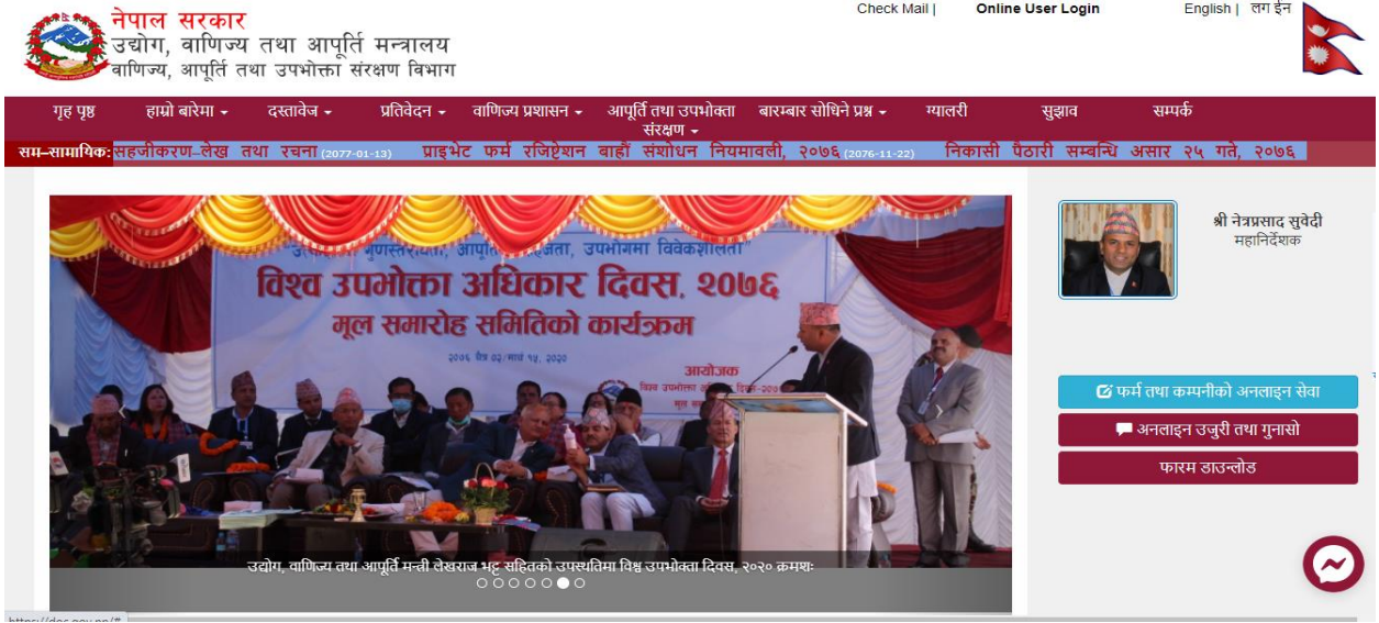
चित्र नं - १